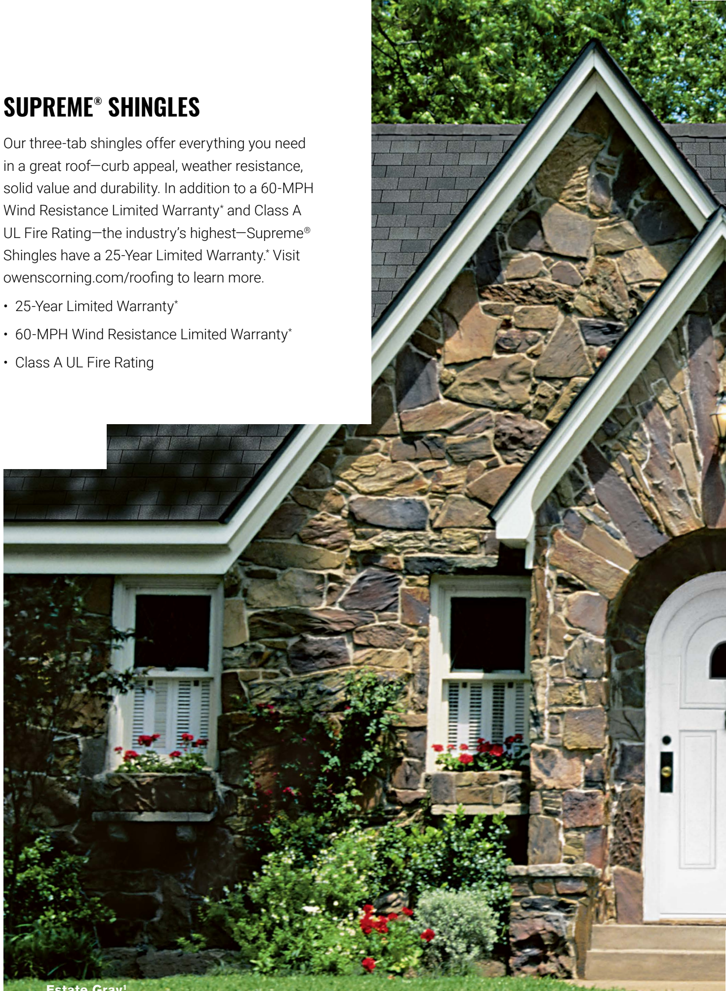
Estate Gray 1