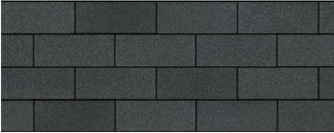
Onyx Black 1