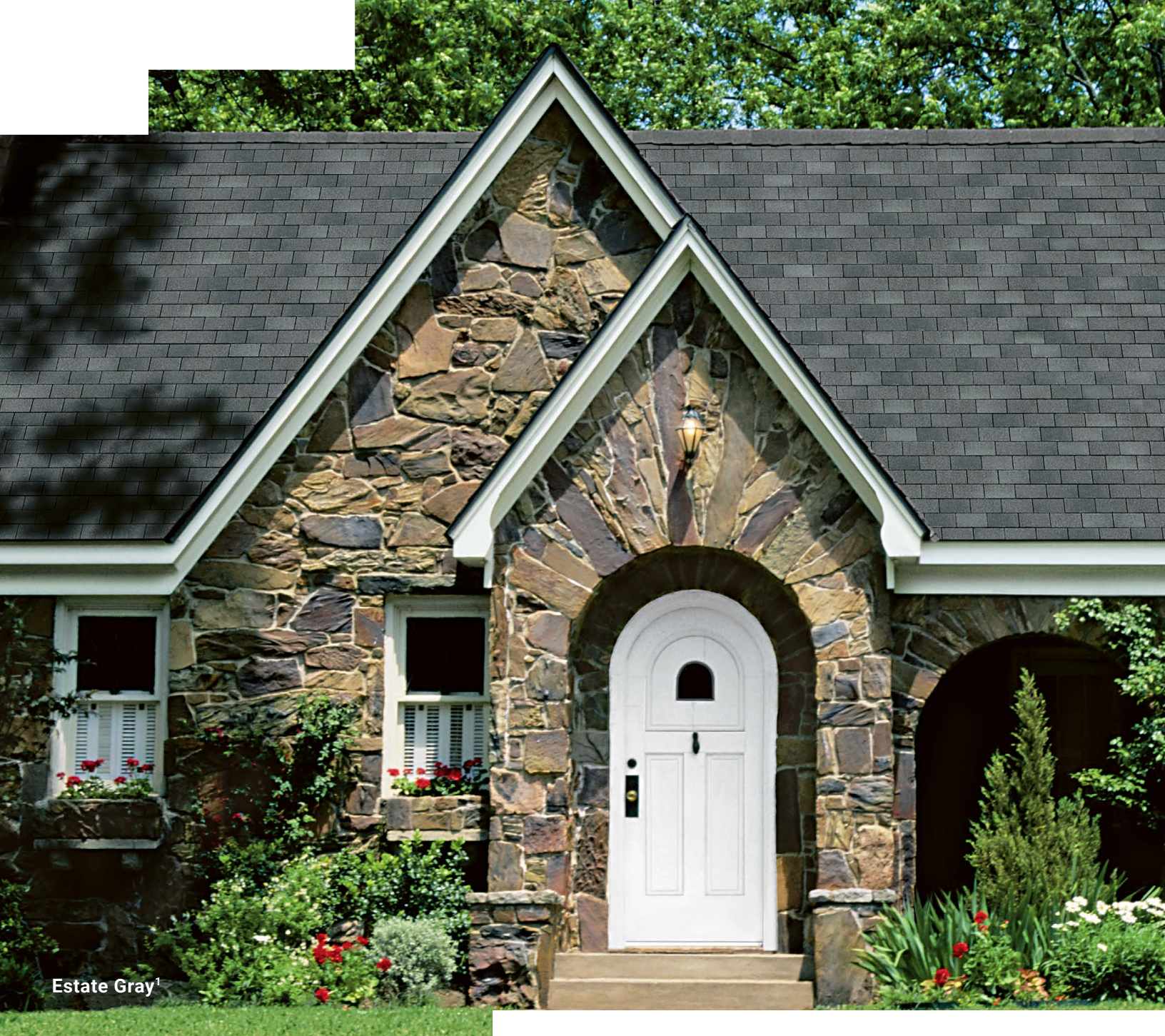
Estate Gray 1