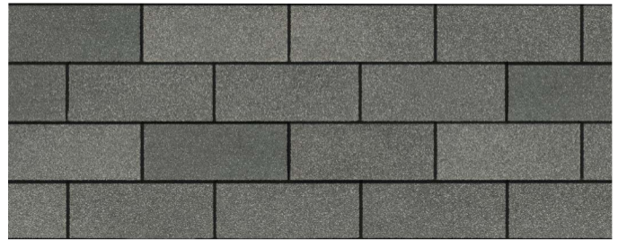
Estate Gray 1