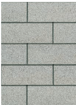
Shasta White 1