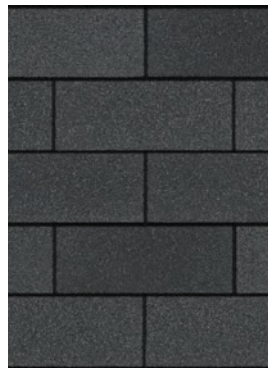
Onyx Black 1