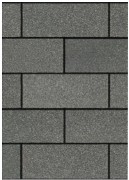
Estate Gray 1