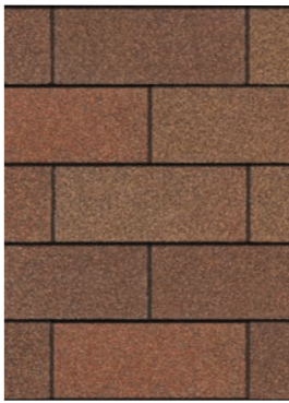
Autumn Brown 1

CONSULTE LA TABLA Y EL MAPA PARA CONOCER LA DISPONIBILIDAD DE COLORES