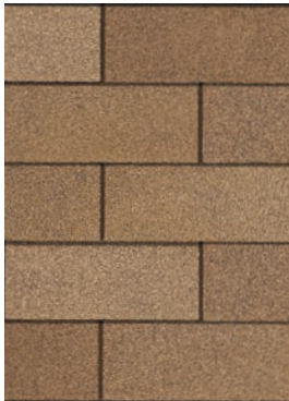
Desert Tan 1