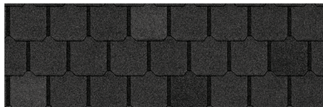
Canterbury Black 1