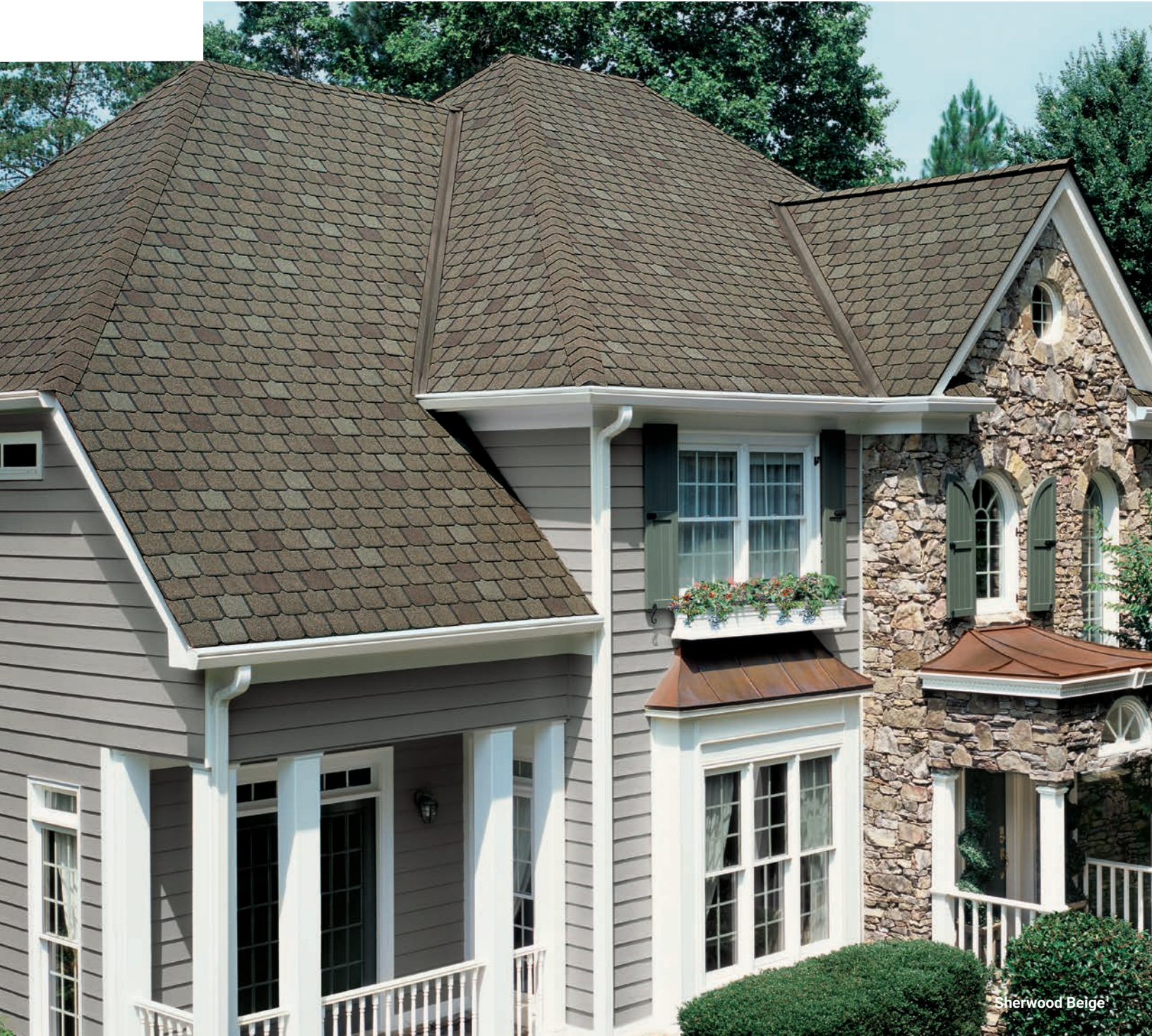
Sherwood Beige ®