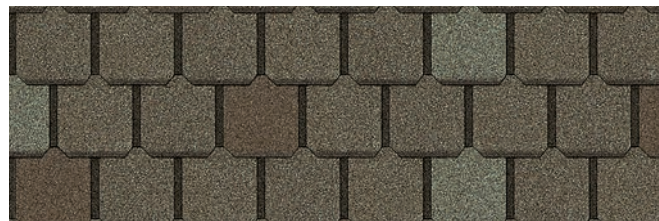
Sherwood Beige 1