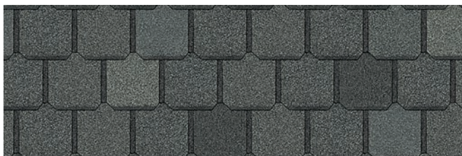
Manchester Grey 1