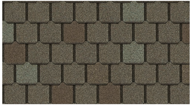
Sherwood Beige 1