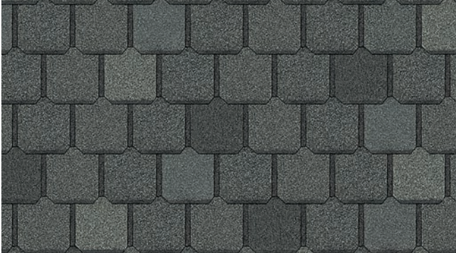
Manchester Grey 1