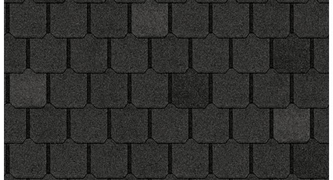
Canterbury Black 1