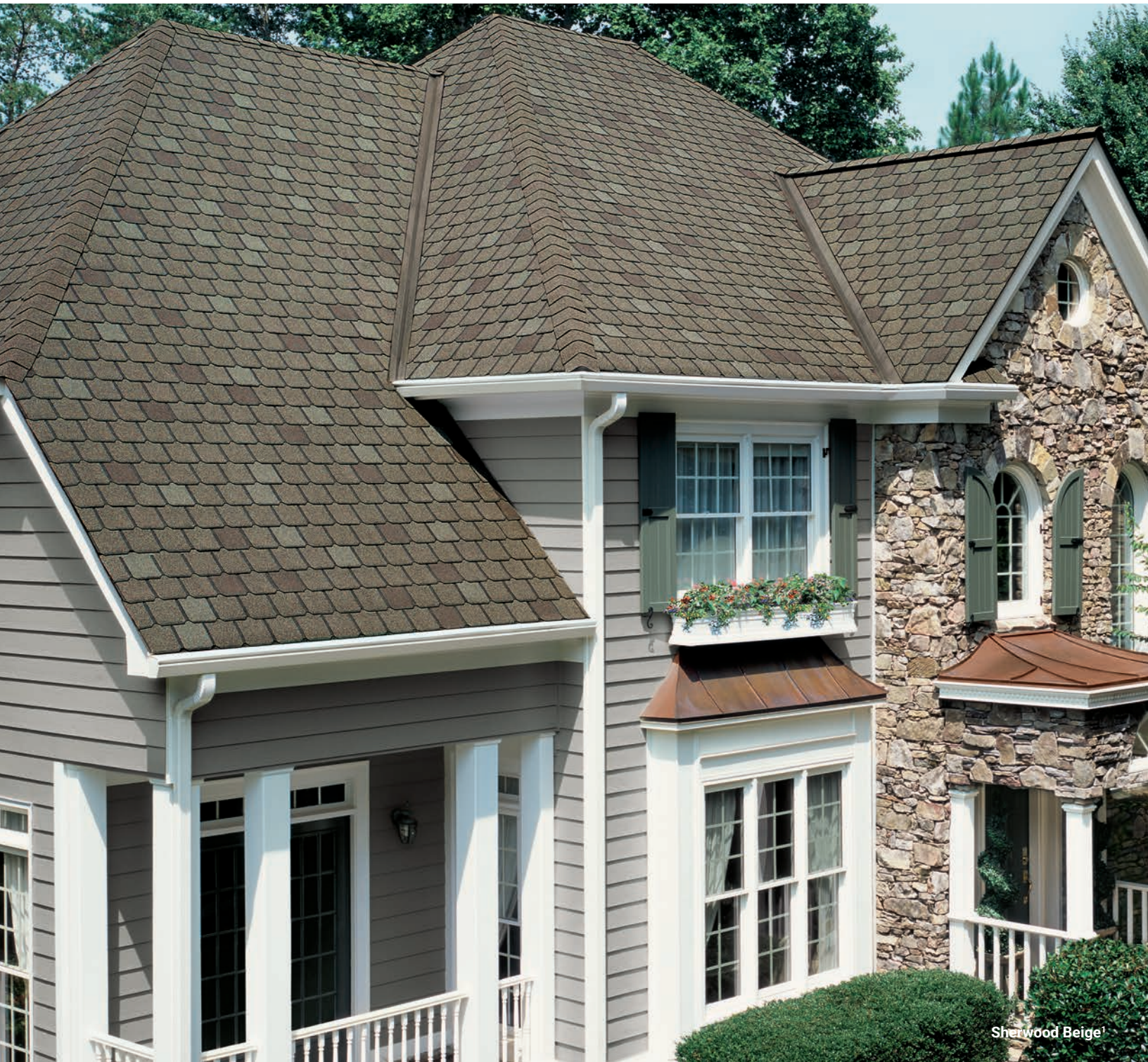
Sherwood Beige 1